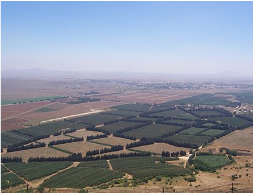
Оккупированные Голанские высоты и открывающийся с них вид на Дамаск

Характерно и то, что опять-таки на днях израильская армия объявила о создании специального подразделения для проведения операций на Голанских высотах. В заявлении, опубликованном ЦАХАЛ в социальной сети Х* (заблокирована в РФ), отмечается, что это подразделение под названием «Fara» создано «в рамках совершенствования оперативного вмешательства на Голанских высотах», комплектуется из «специальных резервных частей и еврейских поселенцев, проживающих в регионе, и будет способно мобилизовать силы в регионе».