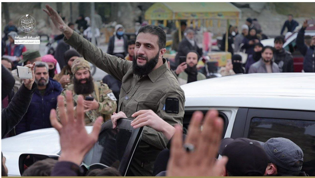
Главарь террористов аль-Джуляни в Алеппо

Симптоматично, что одновременно с боевиками Идлиба активизировались поддерживаемые американцами курды из «Сирийских демократических сил», попытавшиеся захватить позиции сирийской армии на восточном берегу Евфрата. Используя промахи властей в Дамаске, возмнивших себя едва ли не главными победителями в ходе гражданской войны последних лет, и в частности – страсть к личному обогащению и неуступчивость в «курдском вопросе», Турция, Израиль и США будут и далее наращивать усилия по фрагментации арабской страны, меняющиеся зоны контроля на территории которой уже отчасти напоминают границы административных единиц бывшей Османской империи.