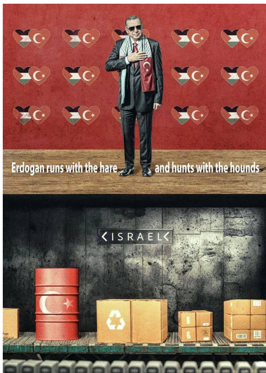
Одна из карикатур, характеризующих отношения Турции и Израиля

Доказательств прямой вовлечённости Анкары обострение на севере Сирии и её прямой поддержки боевиков радикальных группировок – более чем достаточно . На захваченных территориях в Алеппо, южном Идлибе и северной Хаме вывешиваются турецкие флаги и турецкие националистические плакаты. Несмотря на сдержанные официальные комментарии и попытки дистанцироваться от происходящего, имеются основания полагать, что зелёный свет к наступлению боевиков в этом регионе дала именно Турция, причём сперва было запланировано ограниченное наступление с целью принуждения «режима Асада» к переговорам на условиях турецкой стороны. Как отмечает германская Der Spiegel, нынешняя операция готовилась полгода. А повторное требование