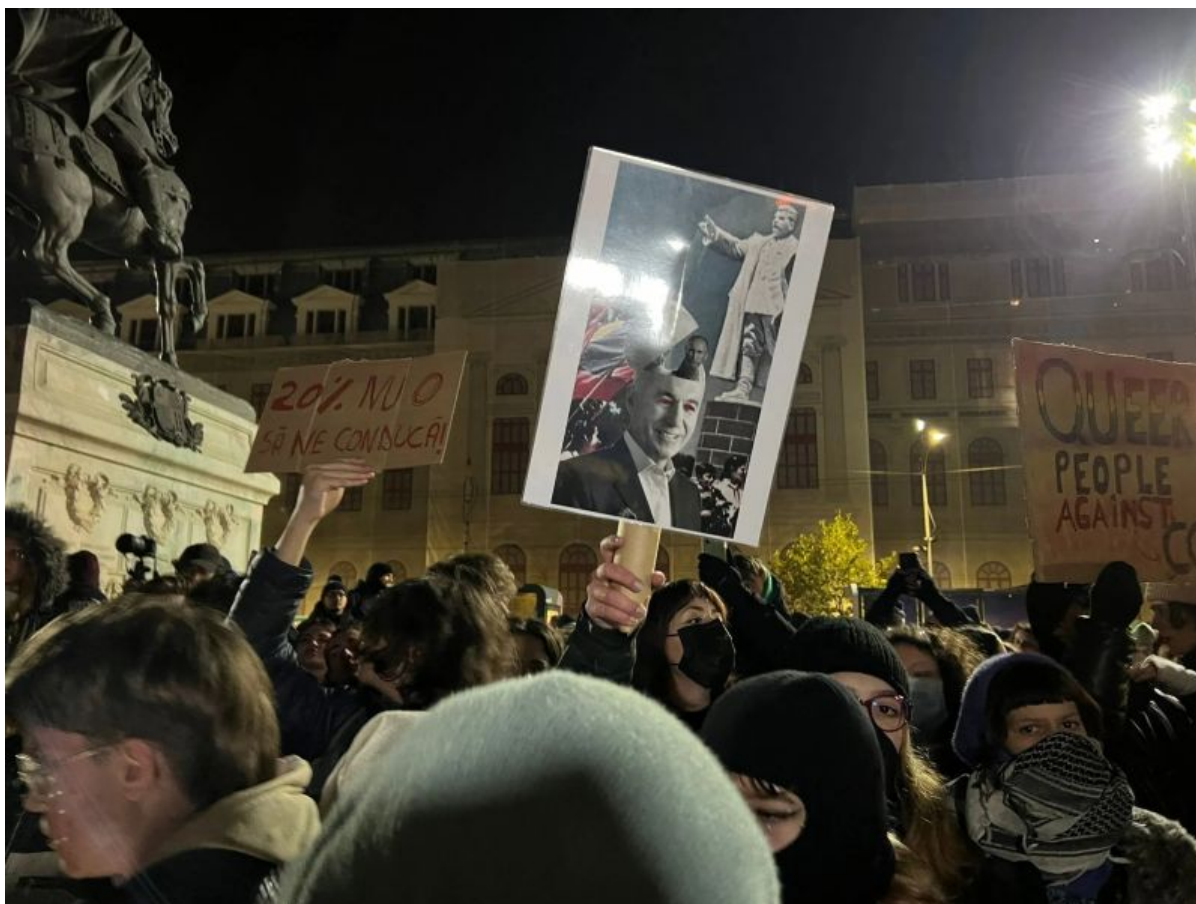
Протесты против Джорджеску организованы в Брашове и в других городах

В Москве пока сдержанно характеризуют возможные перемены в Румынии: «...я пока не стал бы давать никаких прогнозов, да и, наверное, нельзя сказать, что мы так близко знакомы с мировоззрением этого кандидата в том, что касается отношений с нашей стороной, пока хорошо нам понятно действующее руководство Румынии, не является дружественной нам страной», – заявил пресс-секретарь Президента России Дмитрий Песков, отвечая на соответствующий вопрос журналистов. И действительно, как свидетельствует опыт некоторых других восточно-европейских государств и их стремящихся к независимости лидеров, ничто не исключено и всё возможно. Впрочем, результаты голосования 24 ноября свидетельствуют о серьёзном сдвиге в унастроениях значительной части граждан. Победа не имеющего собственной партии Джорджеску 8 декабря, шансы на которую увеличиваются благодаря поддержке со стороны не только П. Симиона, но также и Демократического альянса венгров Румынии (4,5 %), будет способствовать дальнейшему переформатированию политического ландшафта Восточной Европы.